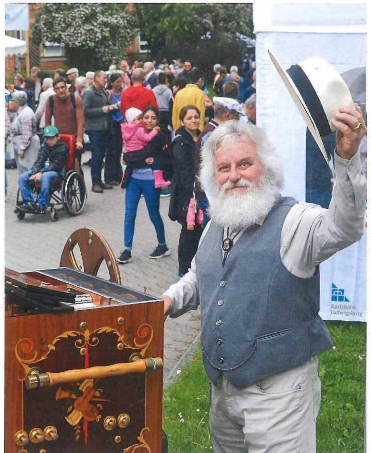
Der Drehorgelmann hat die Besucher beim Jahresfest in der Vergangenheit sehr gut unterhalten.

Eröffnet und beendet wird der Festtag traditionell jeweils mit einem Gottesdienst, zu dem alle Gäste herzlich eingeladen sind. Um 10 Uhr startet er in der Karlshöher Kirche und um